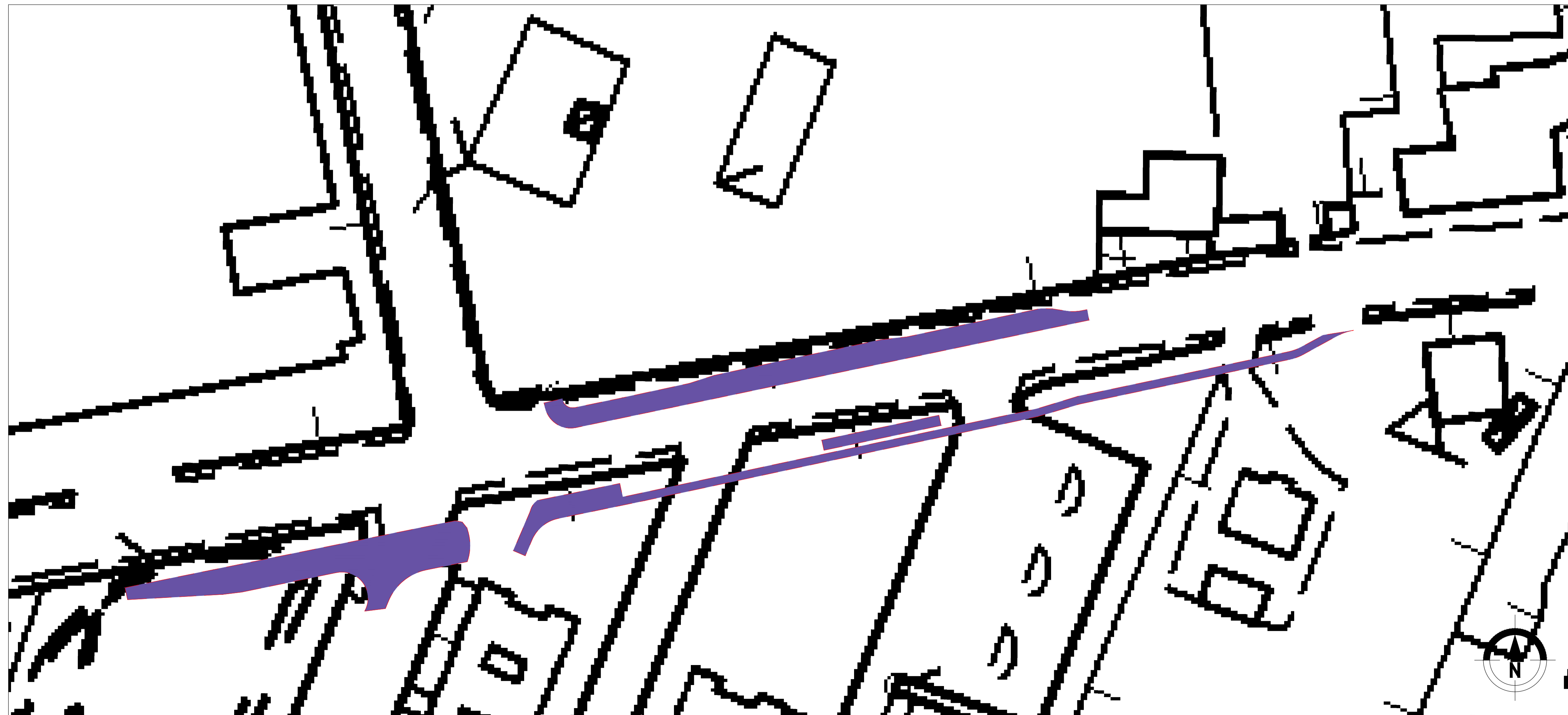
14 PIAZZA DEI COLORI - SCALA 1:500

Elaborato allegato al Documento di Valutazione Archeologica redatto da dott.ssa Chiara Maratini (Dottore di ricerca, archeologo abilitato all'archeologia preventiva)